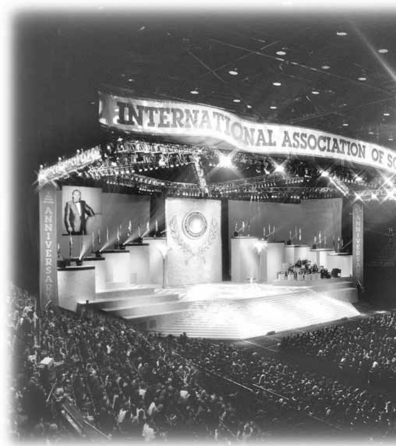
El 8 de octubre de 1993, miles y miles de Cienciólogos de todo el mundo se reunieron en Los Ángeles para escuchar las noticias de esta histórica victoria de la libertad religiosa.