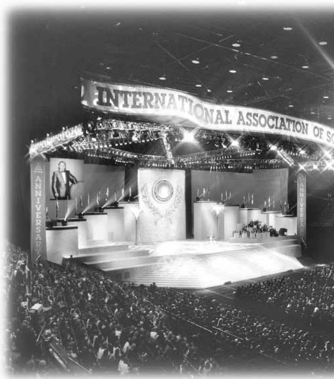
El 8 de octubre de 1993, miles y miles de Cienciólogos de todo el mundo se reunieron en Los Ángeles para escuchar las noticias de esta histórica victoria de la libertad religiosa.